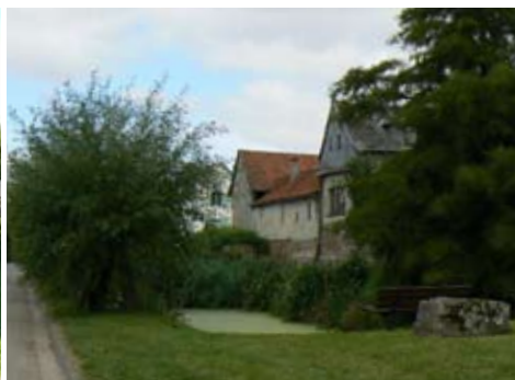
Molliens-aux-bois (80), 2013 - mare non clôturée en coeur de village.