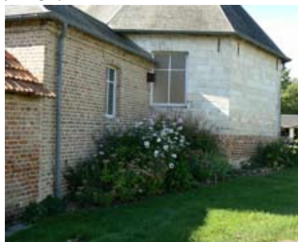
Longuevillette (80), 2013 - Fleurissement en pied d'église.