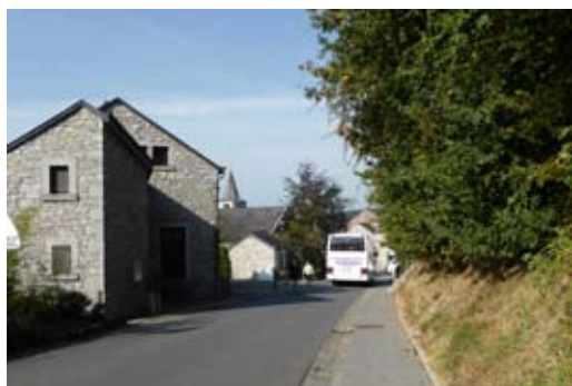
Village de Ny (Be), 2016 - aménagement de rue qualitatif, adapté à l'identité rurale : peu de matériaux différents, matériaux locaux, distinction des entrées de maison, garage par un pavage pierre.