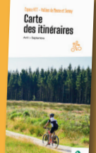
Carte des itinéraires VTT/FFC