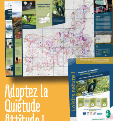
Adoptez la Quiétude Attitude !