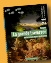
La Grande Traversée du Parc