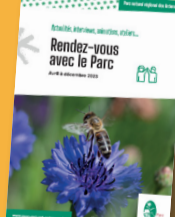
Guide des Rendez-vous avec le Parc